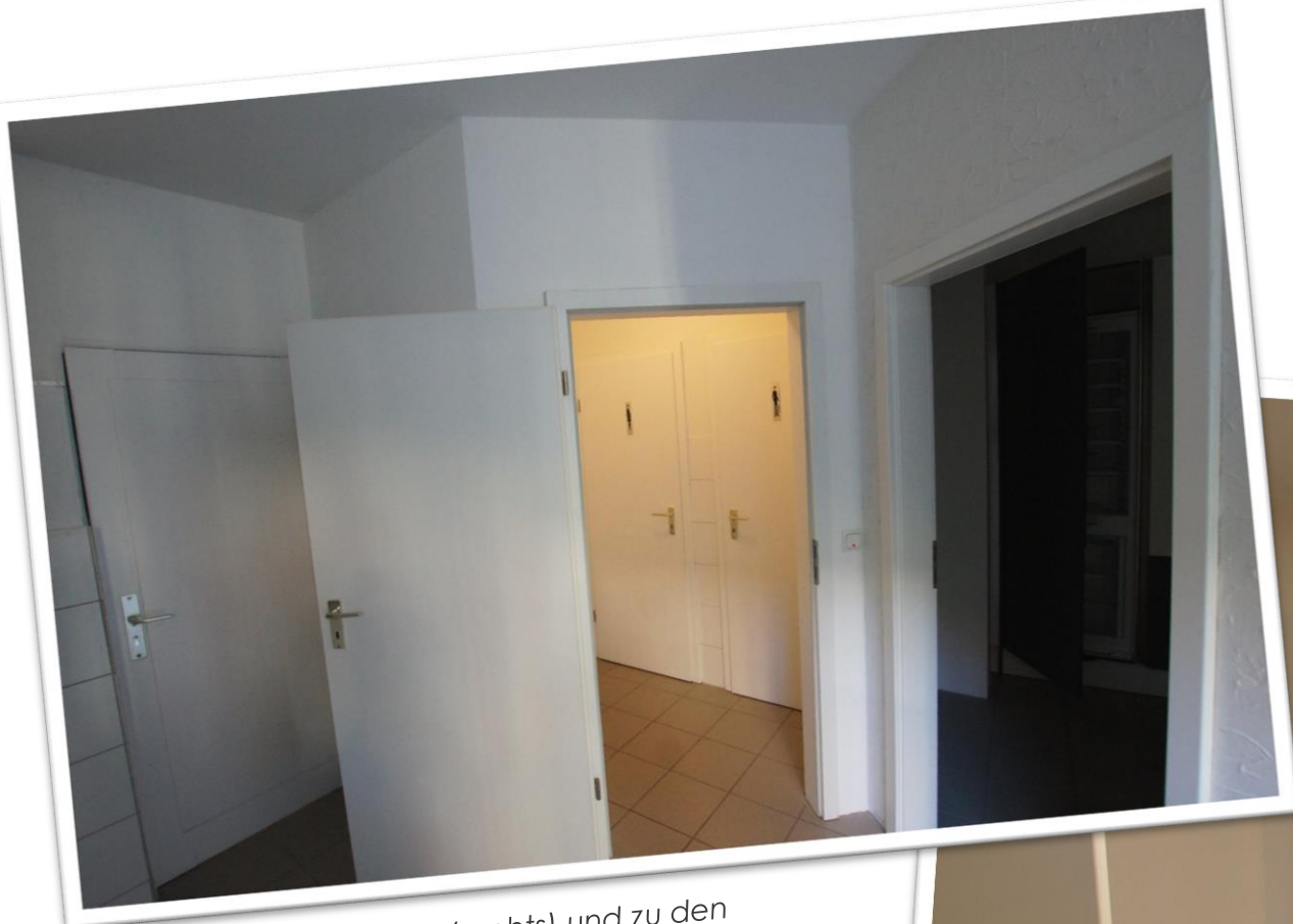
. 4 Zugang zur Küche (rechts) und zu den WCs (mitte)

Ca. 10 qm großer und gefliester Raum mit neuer Küche (Bild 3) sowie eine große Sanitärraum mit Waschgelegenheit und 2 WCs (Bild 4)