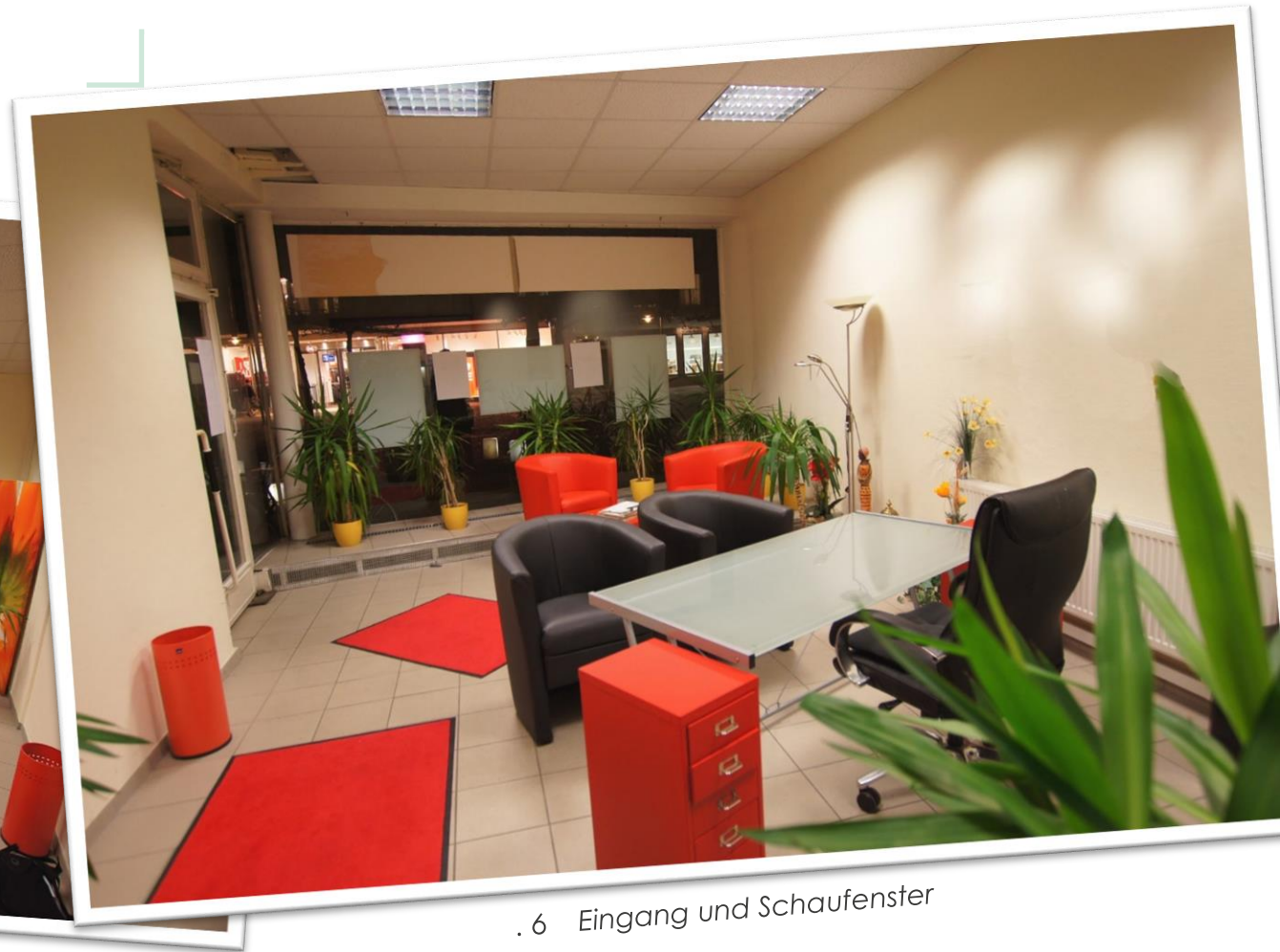
. 6 Eingang und Schaufenster