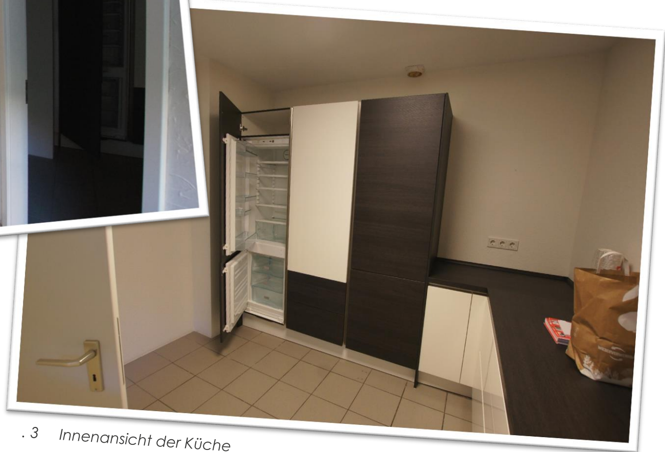
. 3 Innenansicht der Küche