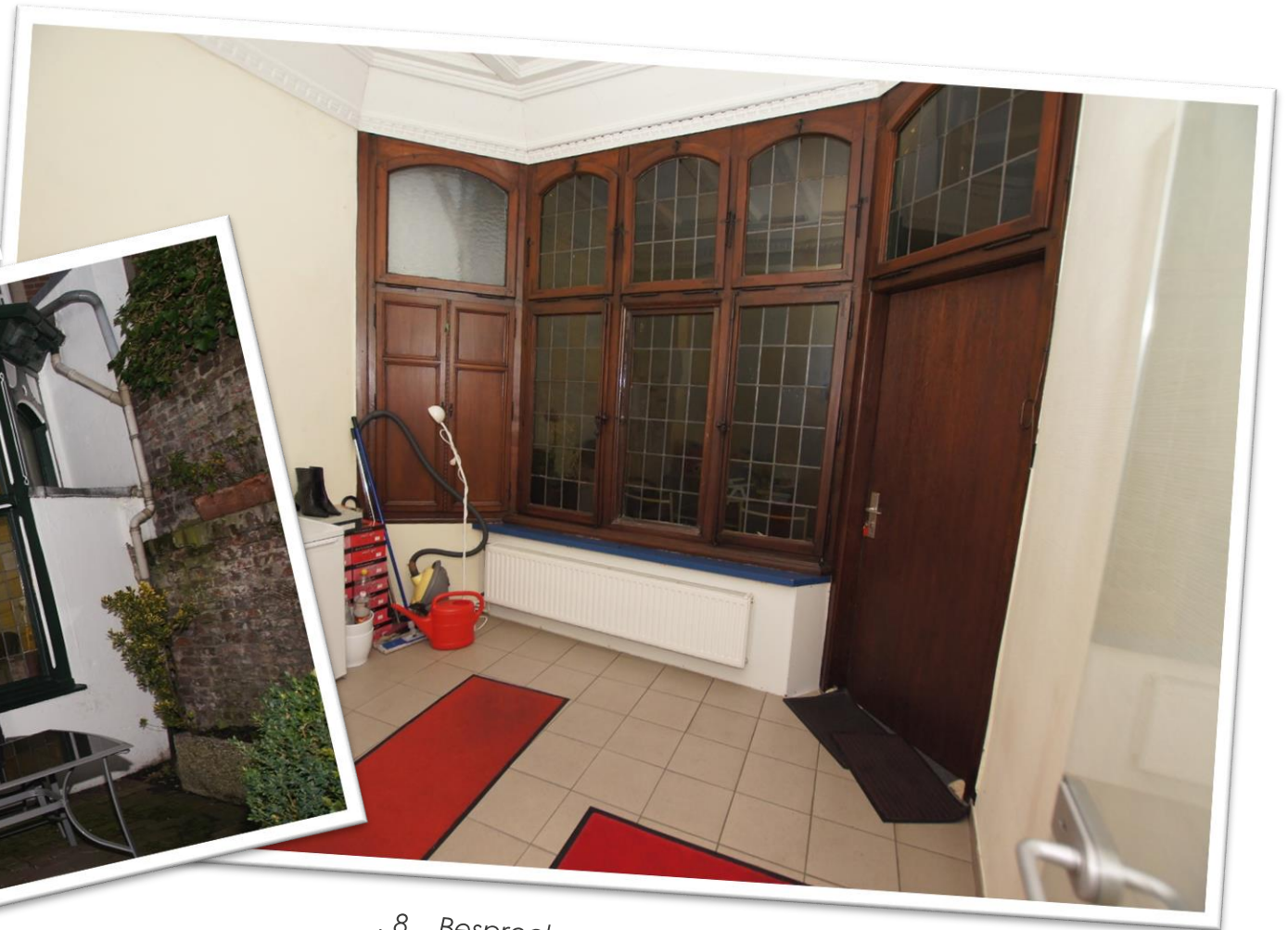
.8 Besprechungsraum im Wintergarten