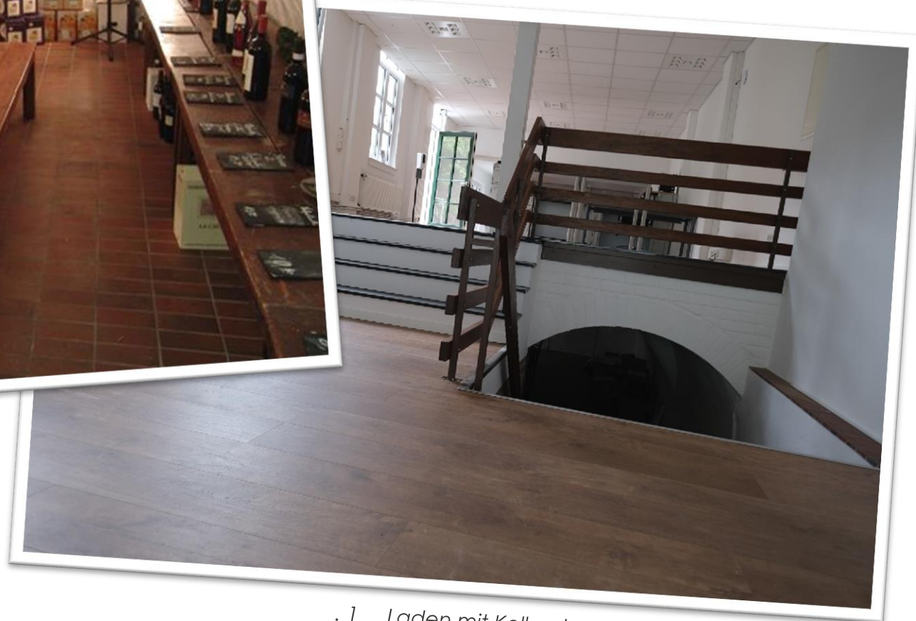
. 1 Laden mit Kellerabgang

46qm zusätzliche Fläche z.B. zu Lagerzwecken oder für Sozialbereiche wie Pausen- oder Aufenthaltsraum für das Team