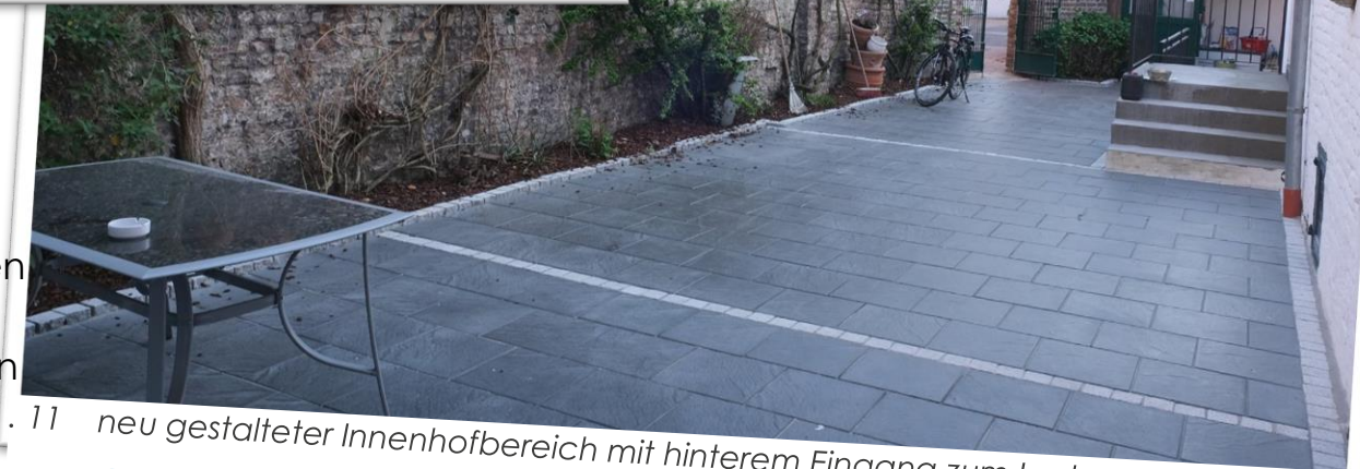
. 11 neu gestalteter Innenhofbereich mit hinterem Eingang zum Laden rechts

Der Innenhof ist über ein Tor (Bild 8) von der angrenzenden Tiefgarage aus oder über den zentralen Flur erreichbar. Er ist zur gemeinschaftlichen Nutzer aller Mietparteien vorgesehen.