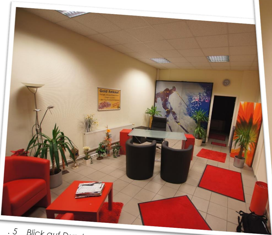
. 5 Blick auf Durchgang zur 2. Raum

Bestehend aus 2 Räumen und nutzbar als Büro- oder Verkaufsfläche und angrenzender Teeküche bzw. Lager- oder Besprechungsraum im historischen Wintergarten.