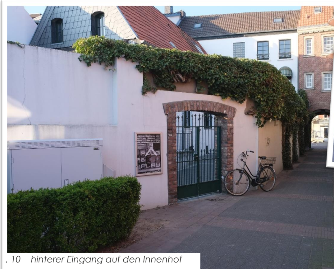
. 10 hinterer Eingang auf den Innenhof