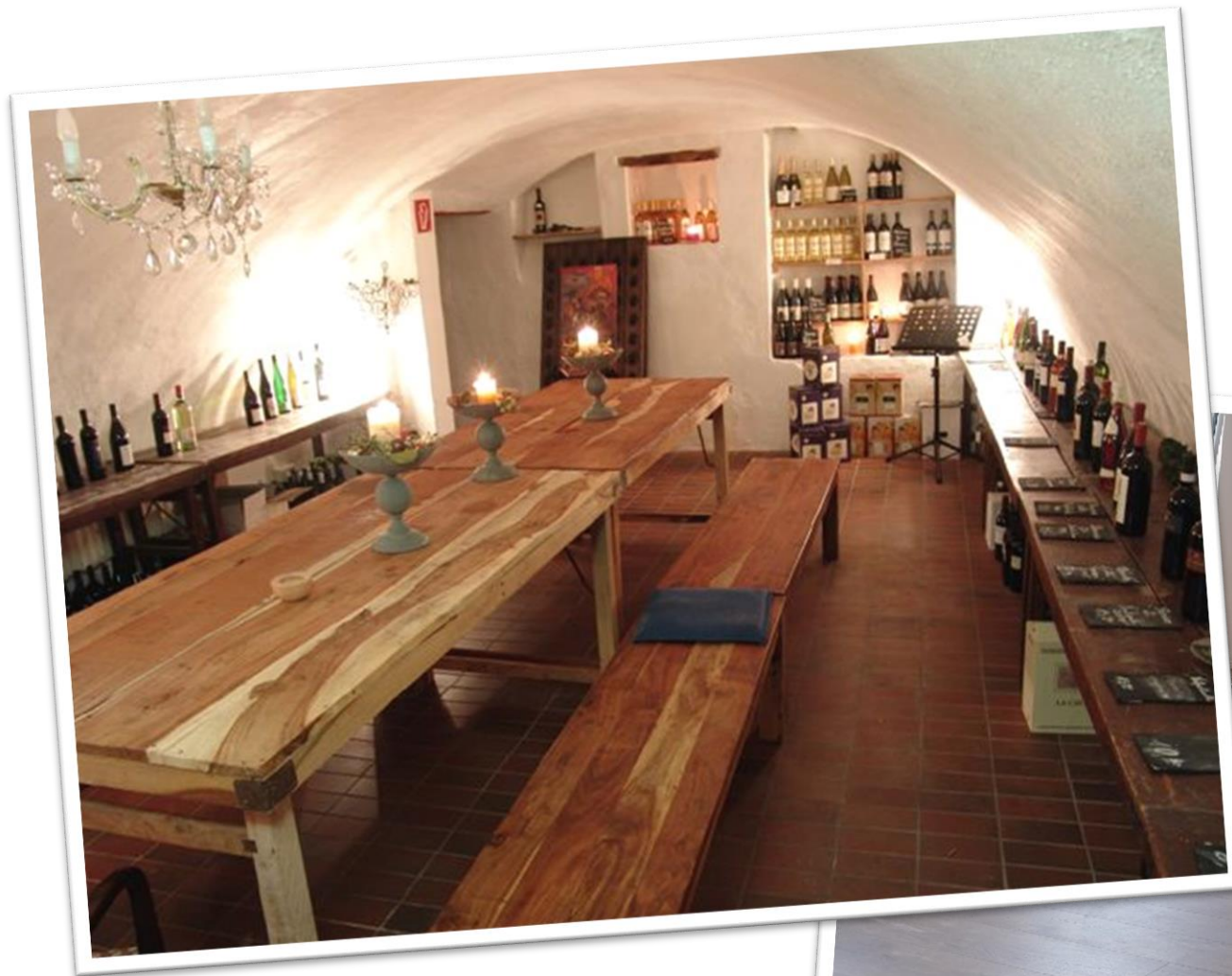
. 2 Gewölbekeller eingerichtet

46qm zusätzliche Fläche z.B. zu Lagerzwecken oder für Sozialbereiche wie Pausen- oder Aufenthaltsraum für das Team