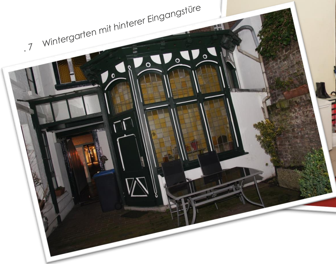
.7 Wintergarten mit hinterer Eingangstüre

Innenansicht des historischen Wintergartens , nutzbar als Besprechungsraum, Chefbüro, Lager oder kleine Küche .